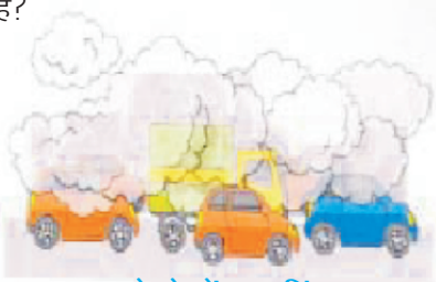
कोहरे में ड्राइविंग

(2) कोहरे के दौरान पीले रंग का कागज ड्राइविंग में कैसे मदद करता है?