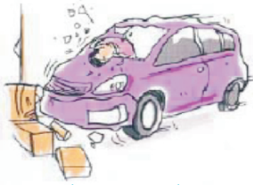
नशा करके वाहन चलाने का प्रभाव

विषयवस्तु : एल्कोहल एक अवसादक पदार्थ (sedative medicine) हैं। जो कि मानसिक प्रक्रिया को मंद करता है। यह व्यक्ति के सोच एवं कार्यप्रदर्शन को प्रभावित करता है। यह बौद्धिक क्षमता एवं शारीरिक समन्वय को प्रभावित करता है। इसके प्रयोग से गति एवं दूरी सम्बन्धी निर्णय लेने की क्षमता दुर्बल होती है तथा दृष्टि बाधित होने से दुर्घटनाओं की सम्भावना बढ़ती हैं। यह सन्तुलन एवं समन्वय (coordination) को दुर्बल करती है।