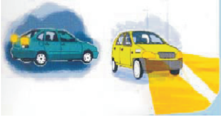
डिपरबीम रात्रि में ड्राइविंग में सहायक होती है

आगे निकलना) के समय तथा मोड़ पर विशेष सावधानीपूर्वक गाड़ी चलावें। ट्रैफिक अधिकारियों द्वारा गाड़ी चलाने का लाईसेंस जारी करते समय आँखों की सावधानीपूर्वक जाँच की जानी चाहिए। आँखें चेहरे का सबसे संवेदनशील अंग है अतः इनकी सुरक्षा आवश्यक है।