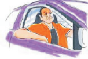
चालक नींद एवं थकान महसूस करता हुआ

ड्राइविंग मस्तिष्क में संगृहीत सूचनाओं के आधार पर संचालित प्रक्रिया है। दृढ़ इच्छा के अभाव में, भावनात्मक व्यक्ति सड़क पर अनापेक्षित व्यवहार करते हैं। ये अपशब्दों का प्रयोग कर दूसरों एवं स्वयं को आहत / अपमानित करते हैं। अनेक बार इसके