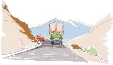
पहाड़ी सड़कों के ढलान पर गाड़ी चलाना कठिन है