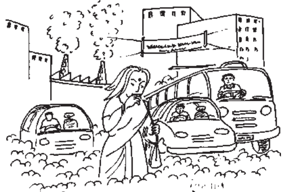
चित्र 16.1 वायु प्रदूषण के प्रभाव

6.1 वायु प्रदूषण- जब वायुमण्डल में बाह्य स्रोतों से धूल, गैस, दुर्गन्ध, धुआँ और वाष्प इतनी मात्रा में उपस्थित हो जाए कि उससे वायु के मूल गुणों में अंतर आ जाए तथा उससे मानव जीवन और संपत्ति को नुकसान होने लगे तो उसे वायु प्रदूषण कहते हैं।