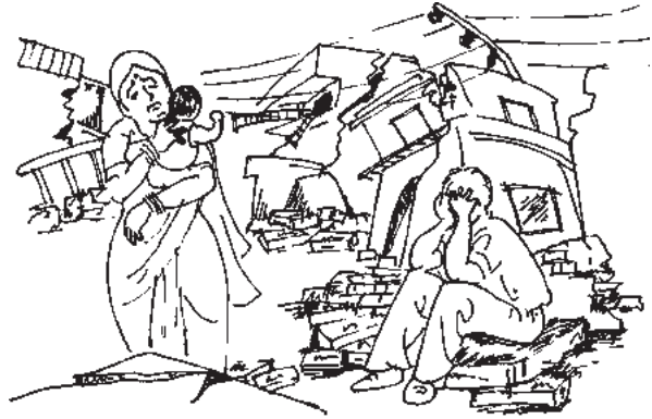
चित्र 16.4 भूकम्प

1. भूकंप- भूकंप की उत्पत्ति पृथ्वी के आंतरिक भाग में असंतुलन से होती है। पृथ्वी के आंतरिक भाग की तापीय दशाओं में परिवर्तन से भूपृष्ठ के अकस्मात कंपन को भूकंप कहते हैं। भूकंप से उत्पन्न तरंगों का घातक प्रभाव हजारों वर्ग किलोमीटर तक होता है।