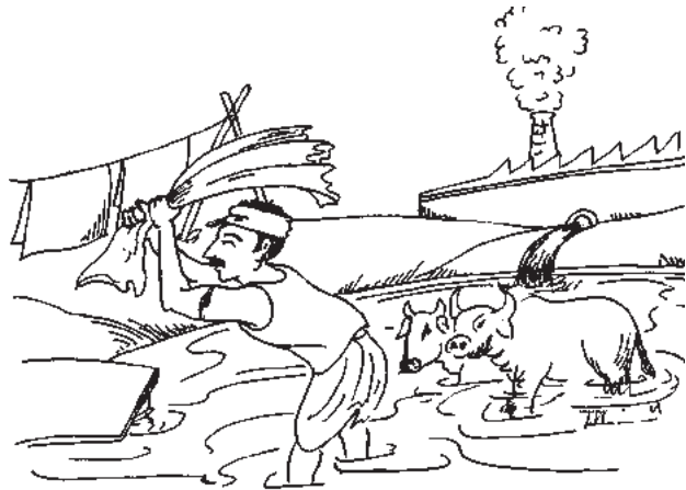
चित्र 16.2 जल प्रदूषण

7. जल प्रदूषण- वह जल जिसमें अनेक प्रकार के खनिज कार्बनिक-अकार्बनिक पदार्थ, गैसों तथा कई अनावश्यक एवं हानिकारक पदार्थ अधिक मात्रा में घुल जाते हैं, प्रदूषित जल कहलाता है।