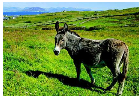
चित्र 9.2 खच्चर

के वांछनीय गुण सम्मिलित हो जाते हैं तथा इस संतति का पर्याप्त आर्थिक महत्त्व होता है; जैसे- खच्चर (चित्र 9.2)। क्या आप जानते हैं कि खच्चर की उत्पत्ति किस संकरण का परिणाम है?