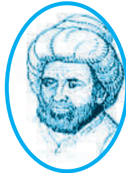
मुहम्मद इब्न मूसा अल-ख्वारिज़्मी (780 – 850 सा.यु.)

प्रमेयिका एक सिद्ध किया हुआ कथन होता है और इसे एक अन्य कथन को सिद्ध करने में प्रयोग करते हैं।