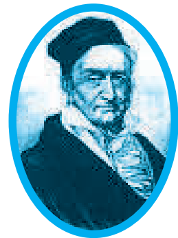
कार्ल फ्रैड्रिक गॉस (1777 – 1855)

अंकगणित की आधारभूत प्रमेय के रूप में विख्यात होने से पहले, प्रमेय 1.2 का संभवतया सर्वप्रथम वर्णन यूक्लिड के एलीमेंट्स की पुस्तक IX में साध्य (proposition) 14 के रूप में हुआ था। परंतु इसकी सबसे पहले सही उपपत्ति कार्ल फ्रैड्रिक गॉस (Carl Friedrich Gauss) ने अपनी कृति डिसक्विशंस अरिथमेटिकी (Disquisitiones Arithmeticae) में दी। कार्ल फ्रैड्रिक गॉस को प्रायः 'गणितज्ञों का राजकुमार' कहा जाता है तथा उनका नाम सभी समयकालों के तीन महानतम गणितज्ञों में लिया जाता है, जिनमें आर्किमिडीज़ (Archimedes) और न्यूटन (Newton) भी सम्मिलित हैं। उनका गणित और विज्ञान दोनों में मौलिक योगदान है।