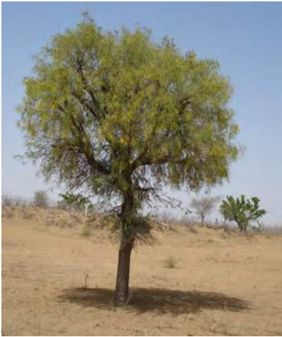
चित्र 16.3 खेजरी वृक्ष

अध्ययनों ने इस बात को स्थापित कर दिया है कि वनों के परंपरागत उपयोग के तरीकों के विरुद्ध पूर्वाग्रह का कोई ठोस आधार नहीं है। उदाहरणतः, विशाल हिमालय राष्ट्रीय उद्यान के सुरक्षित क्षेत्र में एल्पाइन के वन हैं जो भेड़ों के चरागाह थे। घुमंतु (खानाबदोश) चरवाहे प्रत्येक वर्ष ग्रीष्मकाल में अपनी भेड़ें घाटी से इस क्षेत्र में चराने के लिए ले जाते थे। परंतु इस राष्ट्रीय उद्यान की स्थापना के बाद इस परंपरा को रोक दिया गया। अब यह देखा गया है कि पहले तो यह घास बहुत लंबी हो जाती है, फिर लंबाई के कारण जमीन पर गिर जाती है जिससे नयी घास की वृद्धि रुक जाती है। संरक्षित क्षेत्रों में स्थानीय निवासियों को बलपूर्वक रोकने की प्रबंधन नीति संभवतः लंबे समय तक सफल नहीं हो पाई। किसी भी प्रकार से वनों को होने वाली क्षति के लिए केवल स्थानीय निवासियों को ही उत्तरदायी ठहराना ठीक नहीं है। हम औद्योगिक आवश्यकताओं एवं विकास परियोजनाओं जैसे कि सड़क एवं बाँध निर्माण से वनों के विनाश अथवा इसको होने वाली क्षति से आँखें नहीं मूँद सकते। इन संरक्षित क्षेत्रों में पर्यटकों के द्वारा अथवा उनकी सुविधा के लिए की गई व्यवस्था से होने वाली क्षति के बारे में भी विचार करना होगा।