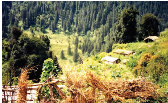
चित्र 16.2 वन्यजीवन का एक दृश्य

उद्योग इन वनों को अपनी फैक्ट्री के लिए कच्चे माल का स्रोत मात्र ही मानते हैं। निहित स्वार्थ से लोगों का एक बड़ा वर्ग सरकार से उद्योगों के लिए कच्चे माल को बहुत कम मूल्य पर प्राप्त करने में लगा रहता है। क्योंकि स्थानीय निवासियों की अपेक्षा इन व्यक्तियों की पहुँच सरकार में काफी ऊपर तक होती है, अतः उन्हें उस क्षेत्र के संपोषित विकास में कोई रुचि नहीं होती। उदाहरण के लिए, किसी वन के टीक के सभी वृक्षों को काटने के बाद, वे दूरस्थ वनों से टीक प्राप्त करने लगेंगे। उन्हें इस बात से कोई मतलब नहीं है कि वे इनका इष्टतम उपयोग सुनिश्चित करें जिससे कि वह आगे आने वाली पीढ़ियों को भी उपलब्ध हो सके। आपके विचार में लोगों को इस प्रकार व्यवहार करने से कैसे रोका जा सकता है?