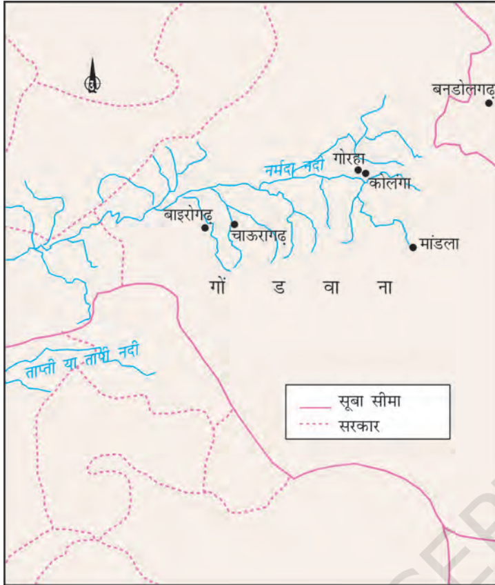
मानचित्र 2 गोंडवाना

दलपत की मृत्यु कम उम्र में ही हो गई। रानी दुर्गावती बहुत योग्य थी और उसने अपने पाँच साल के पुत्र बीर नारायण के नाम पर शासन की कमान सँभाली। उसके समय में राज्य का और अधिक विस्तार हुआ। 1565 में आसिफ़ खान के नेतृत्व में मुग़ल सेनाओं ने गढ़ कटंगा पर हमला किया। रानी दुर्गावती ने इसका जम कर सामना किया। उसकी हार हुई और उसने समर्पण करने की बजाय मर जाना बेहतर समझा। उसका पुत्र भी तुरंत बाद लड़ता हुआ मारा गया।