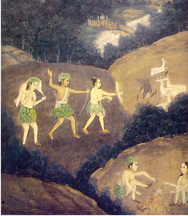
चित्र 2 : रात में भील लोग हिरन का शिकार कर रहे हैं।