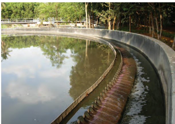
चित्र 18.5 जल अपमथित्र

आपंक को एक पृथक् टंकी में स्थानांतरित किया जाता है, जहाँ यह अवायवीय जीवाणुओं द्वारा अपघटित हो जाता है। इस प्रक्रम में उत्पन्न होने वाली बायोगैस (जैव गैस) का उपयोग ईंधन के रूप में अथवा विद्युत उत्पादन के लिए किया जा सकता है।