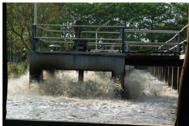
चित्र 18.6 वातित्र

कई घंटों के पश्चात् जल में निलंबित सूक्ष्मजीव टंकी की पेंदी में सक्रिय आपंक के रूप में बैठ जाते हैं। अब शीर्ष भाग से जल को निकाल दिया जाता है। सक्रिय आपंक लगभग 97% जल है। जल को बालू बिछाकर बनाए शुष्कन तलों अथवा मशीनों द्वारा हटा दिया जाता है। शुष्क आपंक का उपयोग खाद के रूप में किया जाता है, जिससे कार्बनिक पदार्थ और पोषक तत्व पुनः मृदा में वापस चले जाते हैं।