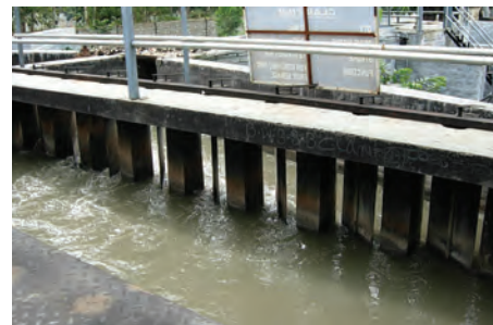
चित्र 18.4 ग्रिट और बालू अलग करने की टंकी