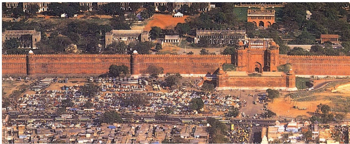
लाल किला (दिल्ली)

यदि अकबर ने इस तरफ़ ध्यान दिया होता और पता लगाया होता कि संसार के दूसरे हिस्सों में क्या हो रहा है तो उसने सामाजिक परिवर्तन की