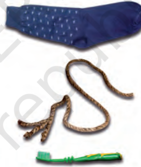
चित्र 3.3 : नाइलॉन से निर्मित विभिन्न वस्तुएँ।

हम नाइलॉन से निर्मित कई वस्तुओं को उपयोग में लाते हैं, जैसे— जुराबें, रस्से, तम्बू, दाँत साफ़ करने का ब्रुश, कारों की सीट के पट्टे, स्लीपिंग बैग (शयन थैला), परदे, आदि (चित्र 3.3)। नाइलॉन का उपयोग पैराशूट