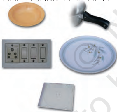
थर्मोसेटिंग प्लास्टिक से निर्मित वस्तुएँ

दूसरी ओर, कुछ प्लास्टिक ऐसे हैं जिन्हें एक बार साँचे में ढाल दिया जाता है तो इन्हें ऊष्मा देकर नर्म नहीं किया जा सकता। ये थर्मोसेटिंग प्लास्टिक कहलाते हैं। दो उदाहरण हैं - बैकेलाइट और मेलामाइन। बैकेलाइट ऊष्मा और विद्युत का कुचालक है। यह बिजली के स्विच, विभिन्न बर्तनों के हथ्थे, आदि बनाने में काम आता है। मेलामाइन एक बहुउपयोगी पदार्थ है। यह आग का प्रतिरोधक है तथा अन्य प्लास्टिक की अपेक्षा ऊष्मा को सहने की अधिक क्षमता रखता है। यह फर्श की टाइलें, रसोई के बर्तन और कपड़े बनाने के उपयोग में लिया जाता है जो आग का प्रतिरोध करते हैं। चित्र 3.8 में थर्मोप्लास्टिक और थर्मोसेटिंग प्लास्टिक के विभिन्न उपयोगों को प्रदर्शित किया गया है।