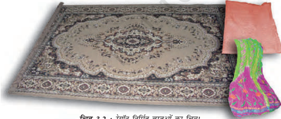
चित्र 3.2 : रेयॉन निर्मित वस्तुओं का चित्र।

आपने कक्षा VII में पढ़ा है कि रेशम कीट से प्राप्त किया जाता है। इसकी खोज चीन में हुई थी और इसे लम्बे समय तक कड़ी सुरक्षा में गोपनीय रखा गया। रेशम रेशे से प्राप्त कपड़ा बहुत मँहगा होता है परन्तु इसकी सुन्दर बुनावट (texture) ने प्रत्येक व्यक्ति को मोह लिया। रेशम को कृत्रिम रूप से बनाने के प्रयास किये गए। उन्नीसवीं शताब्दी के अन्तिम छोर पर वैज्ञानिकों को रेशम समान गुणों वाले रेशे प्राप्त करने में सफलता प्राप्त हुई। इस प्रकार का रेशा काष्ठ लुगदी के रासायनिक उपचार से प्राप्त किया गया। यह रेशा रेयॉन अथवा कृत्रिम रेशम कहलाया। यद्यपि रेयॉन प्राकृतिक स्रोत काष्ठ लुगदी से प्राप्त किया जाता है, यह एक मानव निर्मित रेशा है। यह रेशम से सस्ता होता है परन्तु इसे रेशम रेशों के समान बुना जा सकता है। इसे रंगों की कई किस्मों में रँगा जा सकता है। रेयॉन को कपास के साथ मिलाकर बिस्तर की चादरें बनाते हैं अथवा ऊन के साथ मिलाकर कालीन या गलीचा बनाते हैं। (चित्र 3.2)।