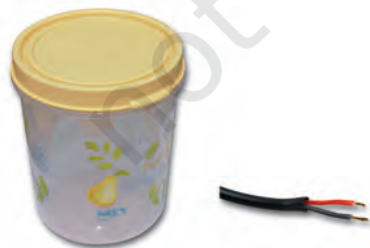
थर्मोप्लास्टिक से निर्मित वस्तुएँ