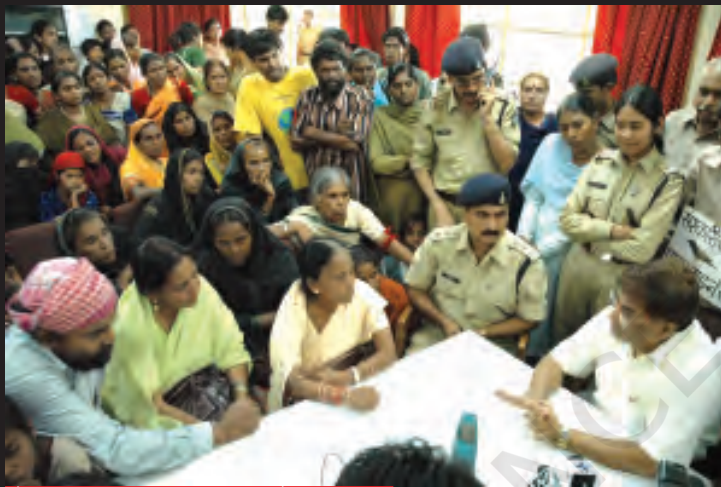
गैस राहत मंत्री से बात करते गैस पीड़ित।

सबूतों से पूरी तरह साफ़ था कि इस महाविनाश के लिए यूनियन कार्बाइड ही दोषी है, लेकिन कंपनी ने अपनी गलती मानने से इनकार कर दिया।