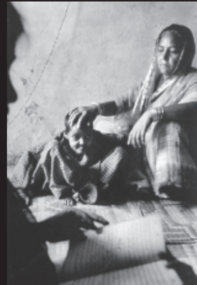
गैस से बुरी तरह प्रभावित एक बच्चा

तीन दिन के भीतर 8,000 से ज्यादा लोग मौत के मुँह में चले गए। लाखों लोग गंभीर रूप से प्रभावित हुए।