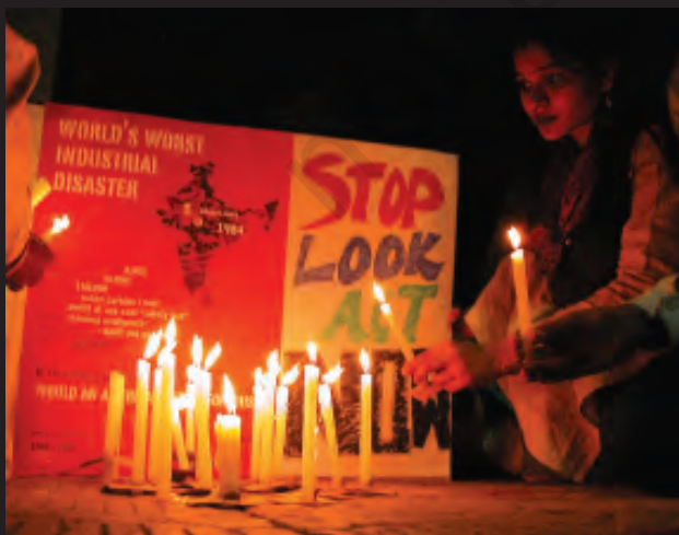
इंसाफ़ की लड़ाई अभी जारी है...।

24 साल बाद भी लोग न्याय के लिए संघर्ष कर रहे हैं। वे पीने के साफ़ पानी, स्वास्थ्य सुविधाओं और यूनियन कार्बाइड के जहर से ग्रस्त लोगों के लिए नौकरियों की माँग कर रहे हैं। उन्होंने यूनियन कार्बाइड के चेयरमैन एंडरसन को सज़ा दिलाने के लिए भी आंदोलन चलाया है।