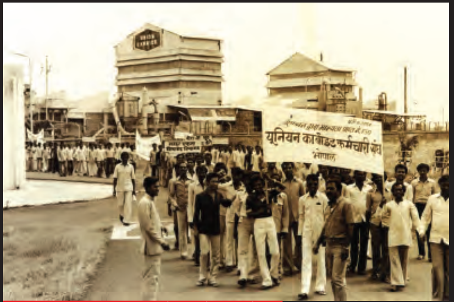
यूनियन कार्बाइड कर्मचारी यूनियन के सदस्यों का आंदोलन

यह तबाही कोई दुर्घटना नहीं थी। यूनियन कार्बाइड ने पैसा बचाने के लिए सुरक्षा उपायों को जानबूझकर नज़रअंदाज़ किया था। 2 दिसंबर की त्रासदी से बहुत पहले भी कारखाने में गैस का रिसाव हो चुका था। इन घटनाओं में एक मजदूर की मौत हुई थी जबकि बहुत सारे घायल हुए थे।