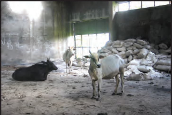
यूनियन कार्बाइड संयंत्र के इर्द-गिर्द बिखरे पड़े रसायनों के बोरे

यूनियन कार्बाइड ने कारखाना तो बंद कर दिया, लेकिन भारी मात्रा में विषैले रसायन वहीं छोड़ दिए। ये रसायन रिस-रिस कर ज़मीन में जा रहे हैं जिससे वहाँ का पानी दूषित हो रहा है। अब यह संयंत्र डाओ कैमिकल नामक कंपनी के कब्जे में है जो इसकी साफ़-सफ़ाई का जिम्मा उठाने को तैयार नहीं है।