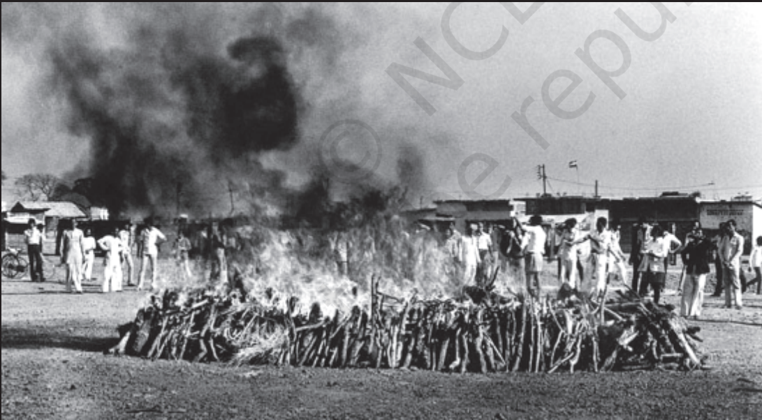
सामूहिक अंतिम संस्कार

जहरीली गैस के संपर्क में आने वाले ज्यादातर लोग गरीब कामकाजी परिवारों के लोग थे। उनमें से लगभग 50,000 लोग आज भी इतने बीमार हैं कि कुछ काम नहीं कर सकते। जो लोग इस गैस के असर में आने के बावजूद जिंदा रह गए उनमें से बहुत सारे लोग गंभीर श्वास विकारों, आँख की बीमारियों और अन्य समस्याओं से पीड़ित हैं। बच्चों में अजीबो-गरीब विकृतियाँ पैदा हो रही हैं। इस चित्र में दिखाई दे रही लड़की इस बात का उदाहरण है।