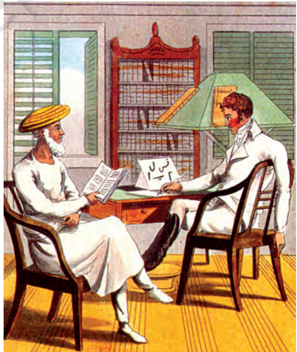
चित्र 1 - विलियम जोन्स फ़ारसी भाषा सीख रहे हैं।

सन् 1783 में विलियम जोन्स नाम के एक सज्जन कलकत्ता आए। उन्हें ईस्ट इंडिया कंपनी द्वारा स्थापित किए गए सुप्रीम कोर्ट में जूनियर जज के पद पर तैनात किया गया था। क़ानून का माहिर होने के साथ-साथ जोन्स एक भाषाविद भी थे। उन्होंने ऑक्सफ़र्ड में ग्रीक और लैटिन का अध्ययन किया था, वे फ्रेंच और अंग्रेज़ी जानते थे और अपने एक दोस्त से अरबी सीखने के अलावा फ़ारसी भी सीख चुके थे। कलकत्ता में