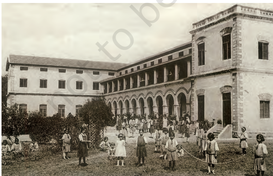
चित्र 12 - कोयम्बटूर के एक प्रचारक स्कूल में खेल रहे बच्चे, बीसवीं सदी का प्रारंभ।

इस प्रकार, बहुत सारे लोग इस बारे में सोचने लगे थे कि एक राष्ट्रीय शिक्षा प्रणाली की रूपरेखा क्या होनी चाहिए। कुछ लोग अंग्रेजों द्वारा स्थापित की गई व्यवस्था में परिवर्तन चाहते थे। उनका मानना था कि इसी व्यवस्था को इस तरह फैलाया जाए कि उसमें ज़्यादा से ज़्यादा लोगों को पढ़ने के मौके मिलें। इसके विपरीत बहुत सारे लोग ऐसे भी थे जो एक वैकल्पिक व्यवस्था चाहते थे ताकि लोगों को सच्चे अर्थों में राष्ट्रीय संस्कृति की शिक्षा दी जा सके। कौन तय करे कि सच्चे अर्थों में राष्ट्रीय क्या होता है? इस “राष्ट्रीय शिक्षा” की बहस स्वतंत्रता के बाद भी जारी रही।