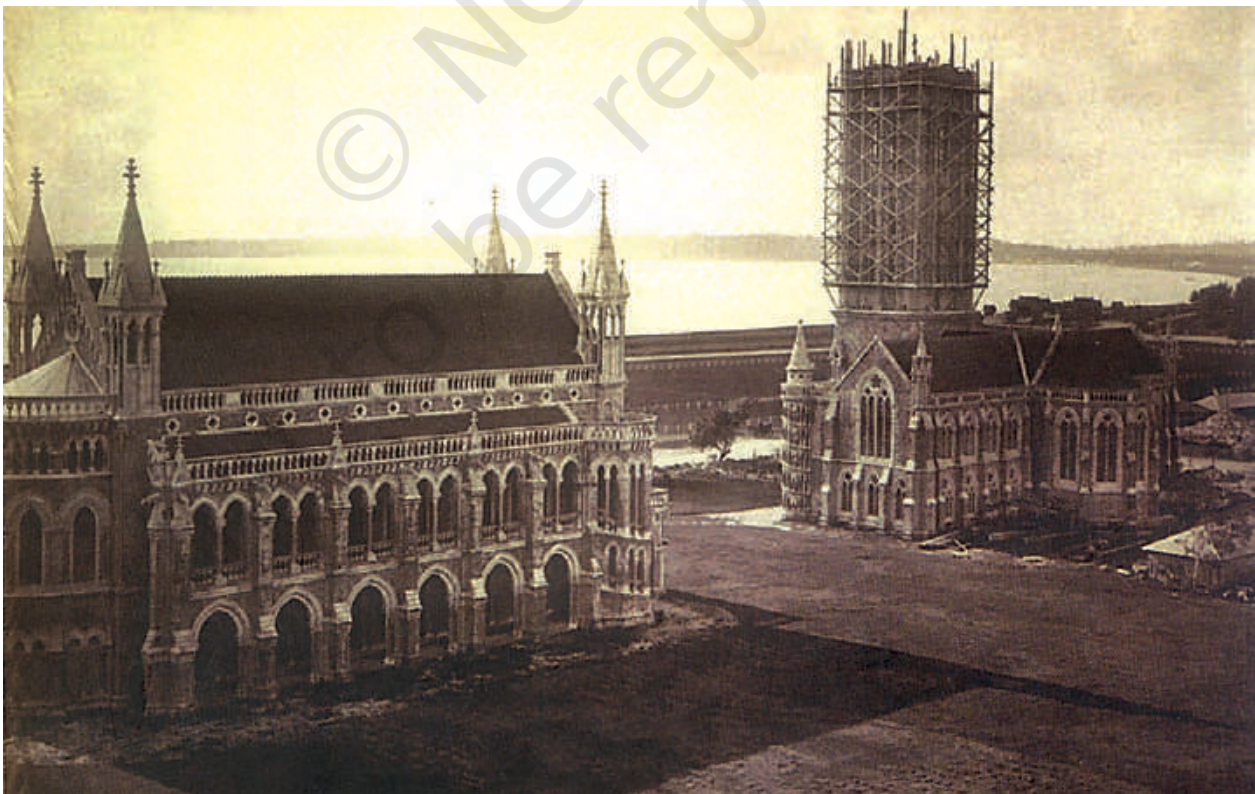
चित्र 5 - उन्नीसवीं सदी में बम्बई विश्वविद्यालय।

कल्पना कीजिए कि आप 1850 के दशक में जी रहे हैं। आपने वुड के नीतिपत्र (वुड्स डिस्पैच) के बारे में सुना है। इसके बारे में अपनी प्रतिक्रियाएँ लिखिए।