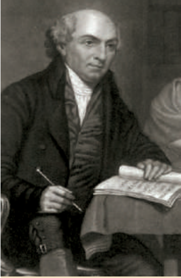
चित्र 6 - स्कॉटलैंड के ईसाई प्रचारक विलियम केरे जिन्होंने सेरामपुर मिशन की स्थापना में मदद की।

उन्नीसवीं सदी में भारत में सक्रिय ईसाई प्रचारकों ने व्यावहारिक शिक्षा के पक्ष में दिए जा रहे तर्कों का घोर विरोध किया। प्रचारकों का मानना था कि शिक्षा का उद्देश्य लोगों के नैतिक चरित्र में सुधार लाना होता है और नैतिकता उत्थान केवल ईसाई शिक्षा के जरिए ही संभव है।