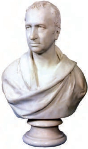
चित्र 2 - हेनरी टॉमस कोलब्रुक। वह संस्कृत तथा हिंदुत्व के प्राचीन धार्मिक ग्रंथों के विद्वान थे।

मदरसा - सीखने के स्थान को अरबी भाषा में मदरसा कहा जाता है। यह किसी भी तरह का स्कूल या कॉलेज या कोई और संस्थान हो सकता है।