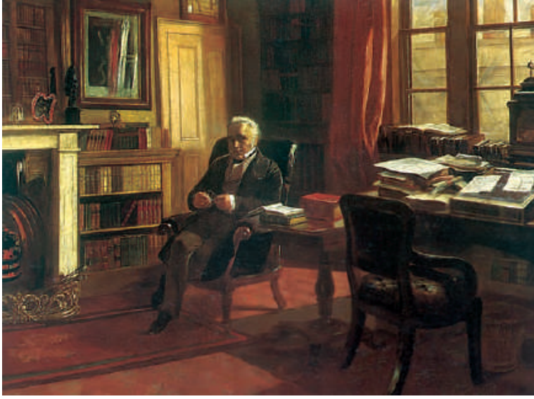
चित्र 4 - थॉमस बैबिंगटन मैकॉले और उनका अध्ययन कक्ष।