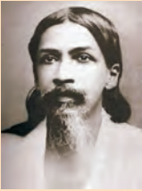
चित्र 9- अरविंदो घोष

अरविंदों घोष ने 15 जनवरी 1908 को बॉम्बे (मुंबई) में अपने एक सम्भाषण में राष्ट्रीय शिक्षा पर बोलते हुए कहा कि इसका लक्ष्य छात्रों में राष्ट्रीयता का भाव जागृत करना है। इसके लिए अपने पूर्वजों के साहसिक कार्यों पर गहराई से चिंतन करना आवश्यक होगा। शिक्षा को मातृ-भाषा में होना चाहिए ताकि यह अधिक-से-अधिक लोगों तक पहुँच सके। अरविंदो ने इस बात पर भी बल दिया कि यद्यपि छात्रों को अपने मूल के साथ जुड़े रहना चाहिए, फिर भी उनको आधुनिक वैज्ञानिक आविष्कारों तथा लोकप्रिय शासन व्यवस्था के संदर्भ में पश्चिमी देशों के अनुभव का भी भरपूर लाभ उठाना चाहिए। इसके अतिरिक्त छात्रों को कोई हस्तकला भी सीखनी चाहिए ताकि वे स्कूल छोड़ने पर यथा संभव रोजगार पा सकें।