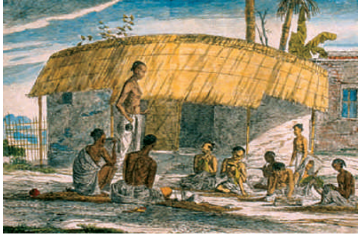
चित्र 8 – एक ग्रामीण पाठशाला।