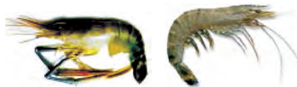
मेक्रोब्रेकियम रोजेन वर्गी (ताजा पानी) पीनस मोनडोन (समुद्री)

भविष्य में समुद्री मछलियों का भंडार (stock) कम होने की अवस्था में इन मछलियों की पूर्ति संवर्धन के द्वारा हो सकती है। इस प्रणाली को समुद्री संवर्धन (मेरीकल्चर) कहते हैं।