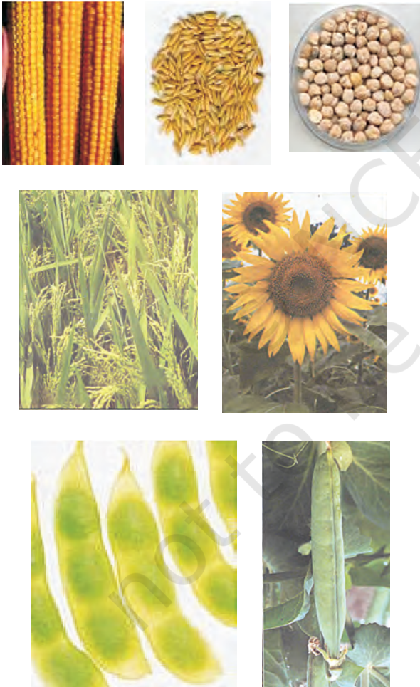
चित्र 15.1: विभिन्न प्रकार की फसलें

ऊर्जा की आवश्यकता के लिए अनाज; जैसे-गेहूँ, चावल, मक्का, बाजरा तथा ज्वार से कार्बोहाइड्रेट प्राप्त होता है। दालें जैसे चना, मटर, उड़द, मूँग, अरहर, मसूर से प्रोटीन प्राप्त होती है और तेल वाले बीजों; जैसे-सोयाबीन, मूँगफली, तिल, अरंड, सरसों, अलसी तथा सूरजमुखी से हमें आवश्यक वसा प्राप्त होती है (चित्र 15.1)। सब्जियाँ, मसाले तथा फलों से हमें विटामिन तथा खनिज लवण, कुछ मात्रा में प्रोटीन, वसा तथा कार्बोहाइड्रेट भी प्राप्त होते हैं। चारा फसलें; जैसे-वर्सीम, जई अथवा सूडान घास का उत्पादन पशुधन के चारे के रूप में किया जाता है।