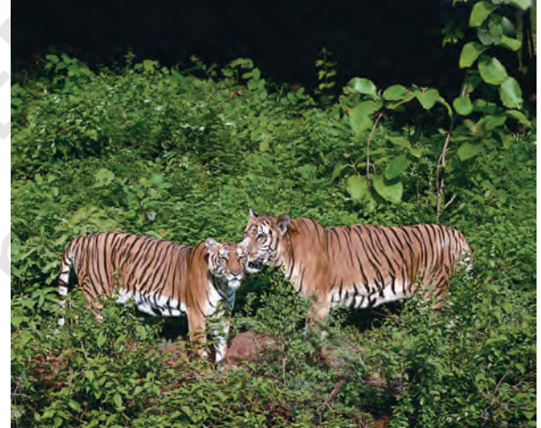
चित्र 1.3 भारत के विभिन्न चिड़ियाघरों में वन्य प्राणी