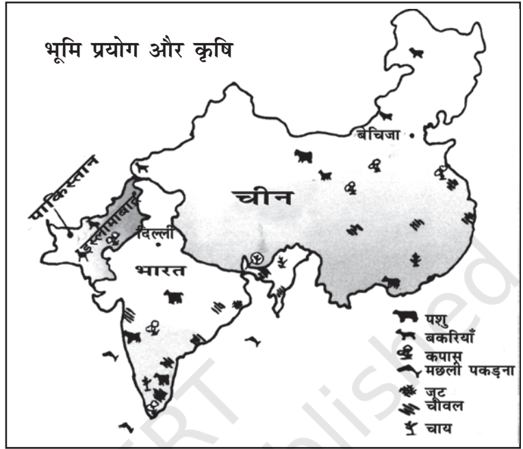
चित्र 10.2 भारत, चीन तथा पाकिस्तान में भूमि-प्रयोग तथा कृषि (स्केल के अनुसार नहीं)

चीन में प्रजनन दर भी बहुत कम है और पाकिस्तान में बहुत अधिक। चीन में नगरीकरण अधिक है। भारत में नगरीय क्षेत्रों में 33 प्रतिशत लोग रहते हैं।