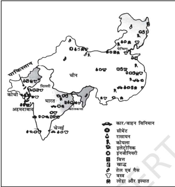
चित्र 10.3 भारत, चीन एवं पाकिस्तान में उद्योग। (स्केल के अनुसार नहीं)

संवृद्धि दरों में मामूली गिरावट आई, जबकि पाकिस्तान में 4 प्रतिशत की अत्यधिक गिरावट आई। कुछ विद्वानों का मत है कि पाकिस्तान में 1988 में प्रारंभ की गई सुधार प्रक्रिया तथा राजनीतिक अस्थिरता इस लंबी अवधि में प्रवृत्ति का मुख्य कारण था। हम अगले अनुच्छेद में इसके बारे में और अधिक अध्ययन करेंगे, कि किस क्षेत्रक ने इन प्रवृत्तियों में योगदान दिया है।