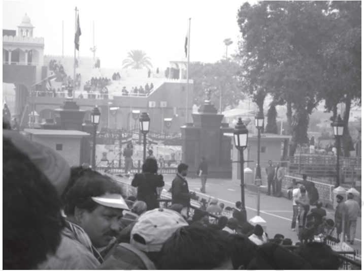
चित्र 10.1 बाघा बॉर्डर केवल पर्यटन स्थल ही नहीं बल्कि भारत तथा पाकिस्तान के

कि स्वामित्व के लिए)। वे प्रकल्पित कर देने के बाद भूमि से होने वाली समस्त आय को अपने पास रख सकते थे। बाद के चरण में औद्योगिक क्षेत्र में सुधार आरंभ किये गये। सामान्य, नगरीय तथा ग्रामीण उद्यमों की निजी क्षेत्रक की उन फर्मों को वस्तुएँ उत्पादित करने की अनुमति थी, जो स्थानीय लोगों के स्वामित्व और संचालन के अधीन थे। इस अवस्था में उद्यमों को जिन पर सरकार का स्वामित्व था, (जिन्हें राज्य के उद्यम एस.ओ.ई. के