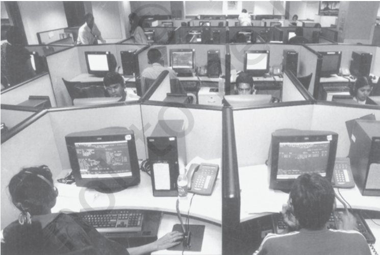
चित्र 3.2 सूचना प्रौद्योगिकी उद्योग का भारत के निर्यात में प्रमुख योगदान

कुछ विद्वानों को आशंका है कि विश्व व्यापार संगठन में भारत की सदस्यता का कोई औचित्य नहीं है, क्योंकि विश्व व्यापार का अधिकांश भाग तो विकसित देशों के बीच ही होता है। उनका यह भी मानना है कि विकसित देश अपने देशों में जहाँ कृषि सहायिकी दिये जाने को लेकर शिकायत करते हैं, वहीं विकासशील देश अपने बाजारों को विकसित देशों के लिए खोले जाने को