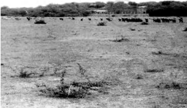
चित्र 6.4 : शुष्क मृदा

शुष्क मृदाओं का रंग लाल से लेकर किशमिशी तक होता है। ये सामान्यतः संरचना से बलुई और प्रकृति से लवणीय होती हैं। कुछ क्षेत्रों की मृदाओं में नमक की मात्रा इतनी अधिक होती है कि इनके पानी को वाष्पीकृत करके नमक प्राप्त किया जाता है। शुष्क जलवायु, उच्च