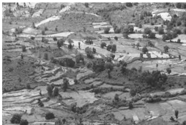
चित्र 6.6 : सीढ़ीदार कृषि

मृदा अपरदन मूल रूप से दोषपूर्ण पद्धतियों द्वारा बढ़ता है। किसी भी तर्कसंगत समाधान के अंतर्गत पहला काम ढालों की कृषि योग्य खुली भूमि पर खेती को रोकना है। 15 से 25 प्रतिशत ढाल प्रवणता वाली भूमि का उपयोग कृषि के लिए नहीं होना चाहिए। यदि ऐसी भूमि पर खेती करना जरूरी भी हो जाए तो इस पर सावधानी से सीढ़ीदार खेत बना लेने चाहिए। भारत के विभिन्न भागों में, अति चराई और स्थानांतरी कृषि ने भूमि के प्राकृतिक आवरण को दुष्प्रभावित किया है, जिससे विस्तृत क्षेत्र अपरदन की चपेट में आ गए हैं। ग्रामवासियों को इनके दुष्परिणामों से अवगत करवा कर इन्हें