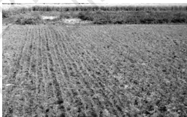
चित्र 6.1 : जलोढ़ मृदा

जलोढ़ मृदाएँ उत्तरी मैदान और नदी घाटियों के विस्तृत भागों में पाई जाती हैं। ये मृदाएँ देश के कुल क्षेत्रफल के