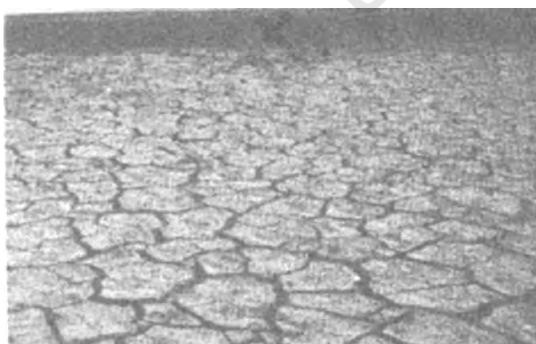
चित्र 6.3 : शुष्क ऋतु में काली मिट्टी

काली मृदाएँ दक्कन के पठार के अधिकतर भाग पर पाई जाती हैं। इसमें महाराष्ट्र के कुछ भाग, गुजरात, आंध्र प्रदेश तथा तमिलनाडु के कुछ भाग शामिल हैं। गोदावरी और कृष्णा नदियों के ऊपरी भागों और दक्कन के पठार के उत्तरी-पश्चिमी भाग में गहरी काली मृदा पाई जाती है। इन मृदाओं को 'रेगर' तथा 'कपास वाली काली मिट्टी' भी कहा जाता है। आमतौर पर काली मृदाएँ मृण्मय, गहरी और अपारगम्य होती हैं। ये मृदाएँ गीले होने पर फूल जाती हैं और चिपचिपी हो जाती हैं। सूखने पर ये सिकुड़ जाती हैं। इस प्रकार शुष्क ऋतु में इन मृदाओं में चौड़ी दरारें पड़ जाती हैं। इस समय ऐसा प्रतीत होता है कि जैसे इनमें 'स्वतः जुताई' हो गई हो। नमी के धीमे अवशोषण और नमी के क्षय की इस विशेषता के कारण काली मृदा में एक लम्बी अवधि तक नमी बनी रहती है।