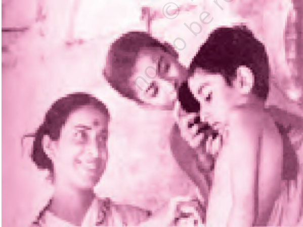
पथेर पांचाली फ़िल्म का एक दृश्य

शूटिंग की शुरुआत में ही एक गड़बड़ हो गई। अपू और दुर्गा को लेकर हम कलकत्ता* से सत्तर मील पर पालसिट नाम के एक गाँव गए। वहाँ रेल-लाइन के पास