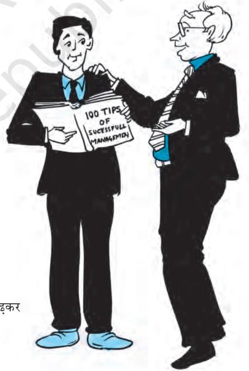
चित्र 1.3—आप सिर्फ किताबें पढ़कर प्रबंधन नहीं सीख सकते।

(ख) मध्य स्तरीय प्रबंध —ये उच्च प्रबंधकों एवं नीचे स्तर के बीच की कड़ी होते हैं, ये उच्च प्रबंधकों के अधीनस्थ एवं प्रथम रेखीय प्रबंधकों के प्रधान होते हैं। इन्हें सामान्यतः विभाग प्रमुख कहते हैं। मध्य स्तरीय प्रबंधक, उच्च प्रबंध द्वारा विकसित नियंत्रण योजनाएँ एवं व्यूह-रचना के क्रियान्वयन के लिए उत्तरदायी होते हैं। इसके साथ-साथ ये प्रथम रेखीय प्रबंधकों के सभी कार्यों