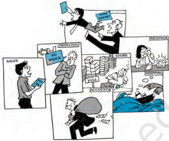
चित्र 1.5—समन्वय के न रहने से असमंजस होगा।

प्रबंधक के विभिन्न कार्यों पर साधारणतया उपरोक्त क्रम में ही चर्चा की जाती है जिसके अनुसार एक प्रबंधक पहले योजना तैयार करता है फिर संगठन बनाता है तत्पश्चात् निर्देशन करता है और अंत में नियंत्रण करता है। वास्तव में प्रबंधक शायद ही इन कार्यों को एक-एक करके करता है। प्रबंधक के कार्य एक दूसरे से जुड़े हैं तथा यह निश्चित करना कठिन हो जाता है कौन-सा कार्य कहाँ समाप्त हुआ तथा कौन-सा कार्य कहाँ से प्रारंभ हुआ।