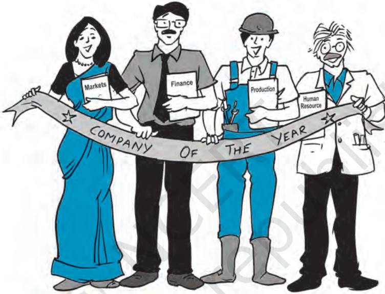
चित्र 1.1-टीम में साथ होने से प्रत्येक अधिक कार्य करता है।

एवं नियंत्रण) की एक शृंखला है। इन कार्यों को सभी प्रबंधक सदा साथ-साथ ही निष्पादित करते हैं। तुमने ध्यान दिया होगा नामची डिज़ाइनर कैडल में स्मिता एक ही दिन में कई अलग-अलग कार्य करती हैं। किसी दिन तो वह