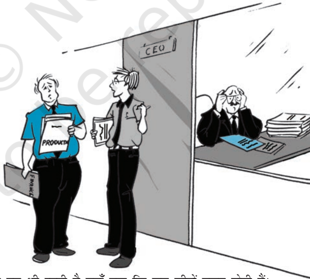
चित्र 8.1—प्रधानता तब भी रहती है यहाँ तक कि जब चीज़ें गलत होती हैं।

(घ) महँगा सौदा—नियंत्रण में खर्चा, समय तथा प्रयासों की मात्रा अधिक होने के कारण, यह एक महँगा सौदा है। एक छोटा उद्यम महँगी नियंत्रण प्रणाली को वहन नहीं कर सकता, क्योंकि इसमें होने वाले खर्चे एक छोटे उद्यम के लिए न्यायसंगत नहीं होते। एक प्रबंधक को चाहिए कि वह यह देखे कि नियंत्रण प्रणाली को लागू करने पर क्या इसके ऊपर होने वाला व्यय लाभकारी होगा अथवा नहीं। दूसरे शब्दों में वह आश्वस्त हो कि व्यय-आय से अधिक न हो। दिए गए बॉक्स से यह प्रकट होता है कि फैडऐक्स कैसी नियंत्रण प्रणाली अपनाती है तथा यह नियंत्रण प्रणाली फैडऐक्स के लाभ में किस प्रकार वृद्धि करती है?