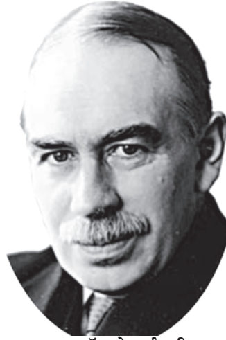
जॉन मेनार्ड कीन्स

ब्रिटिश अर्थशास्त्री जॉन मेनार्ड कीन्स का जन्म 1883 में हुआ था। उनकी शिक्षा किंग्स कॉलेज, कैंब्रिज यूनाइटेड किंगडम में हुई थी और बाद में 'विशेषज्ञ' के रूप में नियुक्त हुए। प्रथम विश्व युद्ध के वर्षों में वे तीक्ष्ण विद्वता के अलावा सक्रिय अंतर्राष्ट्रीय राजनायिक के रूप में भी जुड़े रहे। अपनी पुस्तक 'इकोनॉमिक कंसीक्वेसेज ऑफ द पीस' (1919) में युद्ध की शांति समझौते के भंग होने की भविष्याणी इन्होंने कर दी थी। उनकी पुस्तक 'जनरल थ्योरी ऑफ इंफ्लायमेंट, इंटरेस्ट एंड मनी' (1936) बीसवीं सदी की अर्थशास्त्र की महत्वपूर्ण पुस्तकों में से एक है। कीन्स विदेशी मुद्रा के समझदार सर्टेबाज थे।