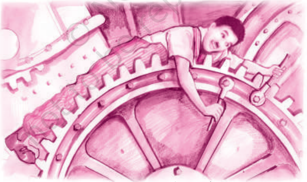
1936 में बनी मॉडर्न टाइम्स फ़िल्म का एक दृश्य

यदि यह वर्ष चैप्लिन की जन्मशती*का न होता तो भी चैप्लिन के जीवन का एक महत्वपूर्ण वर्ष होता क्योंकि आज उनकी पहली फ़िल्म 'मेकिंग ए लिविंग' के 75वर्ष पूरे होते हैं। पौन शताब्दी से चैप्लिन की कला दुनिया के सामने है और पाँच पीढ़ियों को मुग्ध कर चुकी है। समय, भूगोल और संस्कृतियों की सीमाओं से खिलवाड़ करता हुआ चालीं आज भारत के लाखों बच्चों को हँसा रहा है जो उसे अपने बुढ़ापे तक याद रखेंगे। पश्चिम में तो बार-बार चालीं का पुनर्जीवन होता ही है, विकासशील दुनिया में जैसे-जैसे टेलीविज़न और वीडियो का प्रसार हो रहा है, एक बहुत बड़ा दर्शक वर्ग नए सिरे से चालीं को घड़ी 'सुधारते' या जूते 'खाने' की कोशिश करते हुए देख रहा है। चैप्लिन की ऐसी कुछ फ़िल्में या इस्तेमाल न की गई रीलें भी मिली हैं जिनके बारे में कोई जानता न था। अभी चैप्लिन पर करीब 50 वर्षों तक काफ़ी कुछ कहा जाएगा।