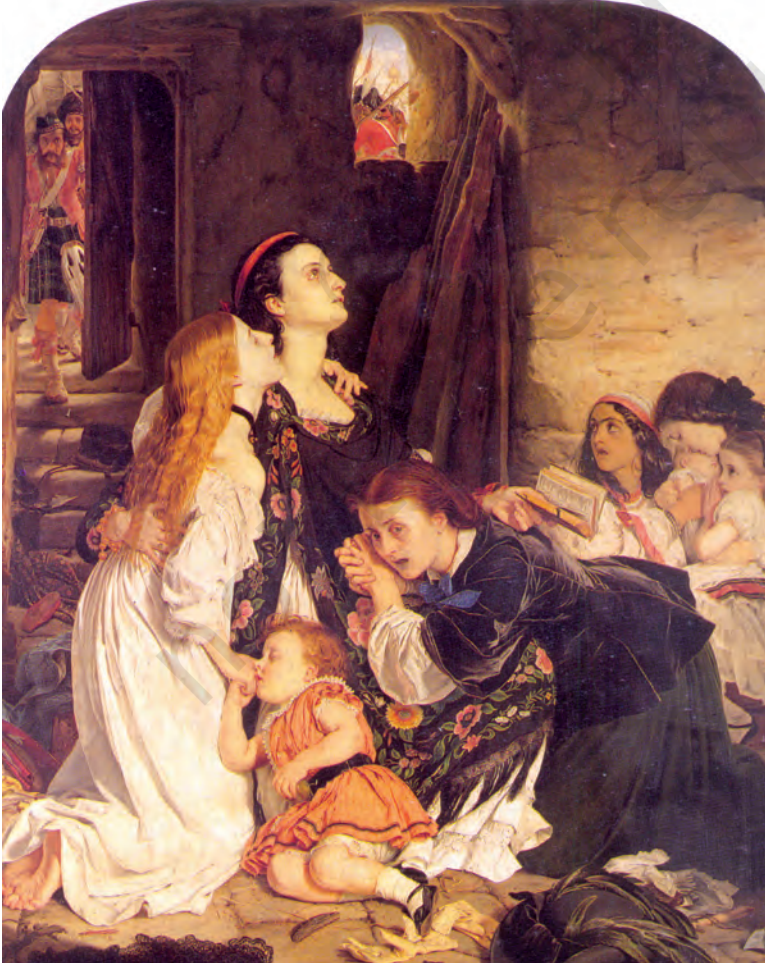
चित्र 11.11 “इन मेमोरियम”, चित्रकार जोज़ेफ़ नोएल पेटन, 1859

जोज़ेफ़ नोएल पेटन ने सैनिक विद्रोह के दो साल बाद “इन मेमोरियम” (‘स्मृति में’, चित्र 11.11) बनाई। इस चित्र में अंग्रेज़ औरतें और बच्चे एक घेरे में एक-दूसरे से लिपटे दिखाई देते हैं। वे लाचार और मासूम दिख रहे हैं, मानो एक भयानक घड़ी की आंशका में हैं।