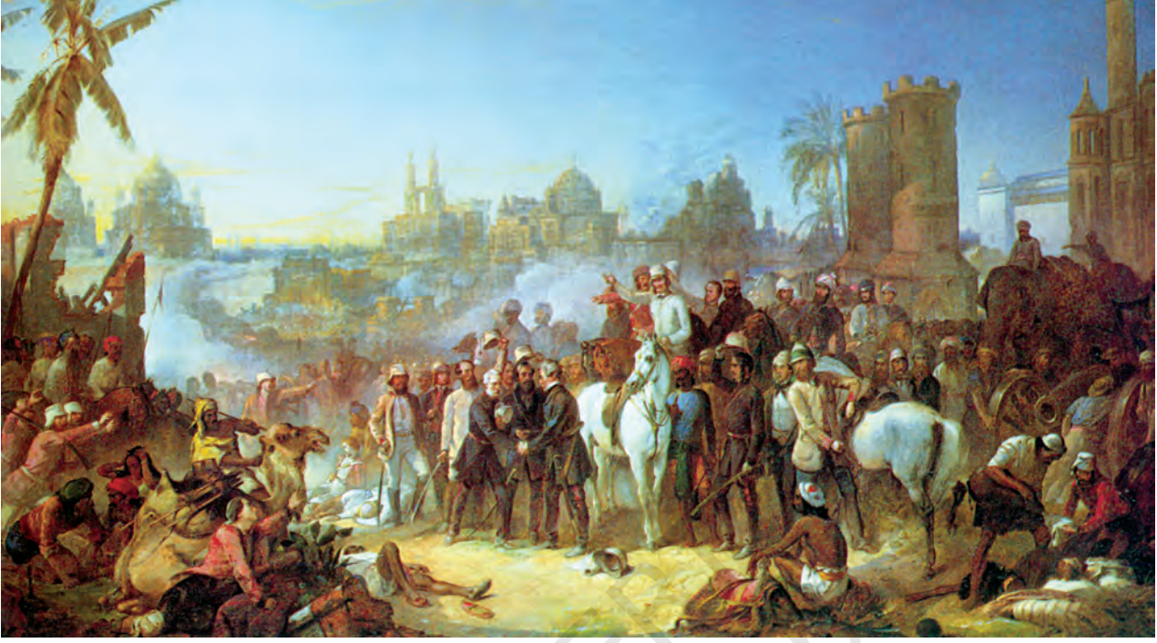
चित्र 11.10 “द रिलीफ ऑफ लखनऊ” चित्रकार टॉमस जोन्स बार्कर, 1859