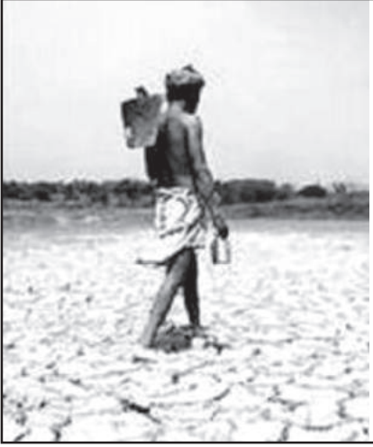
चित्र 5.4 : सूखा ग्रस्त क्षेत्र

सूखा, जैसा कि सामान्य जन द्वारा समझा जाता है, जलवायुगत शुष्कता की ऐसी भीषण परिस्थिति है जो मृदा नमी व जल को पादपों, पशुओं, मानव जीवन के लिए न्यूनतम आवश्यक स्तर से भी कम कर दे (चित्र संख्या 5.4 तथा 5.5) सामान्यतः उष्ण व शुष्क पवनें इसकी संलग्नक होती हैं तथा इसके बाद क्षतिकारक बाढ़ आ सकती है।