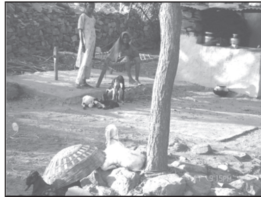
चित्र 5.1 : गरीबी ग्रस्त परिवार

विषयक रूप से अध्ययन में पारिवारिक अथवा व्यक्तिगत इकाई को आधार बनाना चाहिए। इसमें