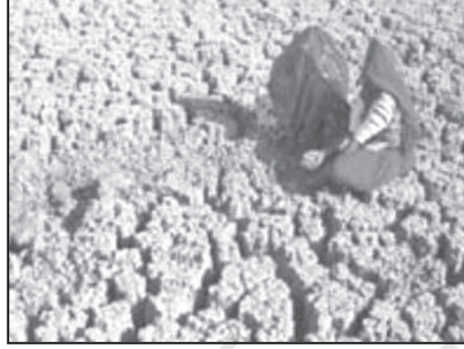
चित्र 5.5 : मृदा की नमी का हास

सूखे को मानवीय दुर्दशा के सबसे मुख्य कारणों में से एक माना गया है। यद्यपि सामान्य रूप से सूखे का संबंध अर्ध शुष्क अथवा मरुस्थली परिस्थितियों से होता है तथापि यह उन क्षेत्रों में भी हो सकता है जहाँ वर्षा व नमी का प्रयाप्त स्तर रहता है। व्यापक अर्थ में कृषि, पशुओं, उद्योगों अथवा मानव की सामान्य जलीय आवश्यकताओं में किसी भी कमी को सूखा कहा जा सकता है। इसका कारण आपूर्ति में कमी जल का प्रदूषण, अपर्याप्त संग्रहण या परिवहन सुविधाएँ अथवा असाधारण माँग आदि में से कोई भी हो सकता है।