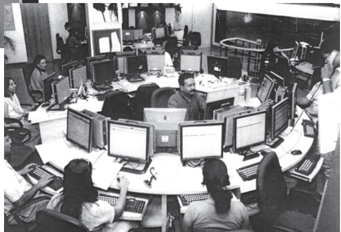
21वीं सदी का दूरदर्शन समाचार कक्ष, भारत

औद्योगिक क्रांति के साथ ही, मुद्रण उद्योग का भी विकास हुआ। कुलीन मुद्रणालय के प्रथम उत्पाद साक्षर अभिजात लोगों तक ही सीमित थे। तत्पश्चात् 19वीं सदी के मध्य भाग में आकर जब प्रौद्योगिकियों, परिवहन और साक्षरता में और आगे विकास हुआ, तभी समाचारपत्र जन-जन तक पहुँचने लगे। देश के विभिन्न क्षेत्रों में रहने वाले लोगों को एक जैसे समाचार पढ़ने या सुनने को मिलने लगे। ऐसा कहा जाता है कि इसी के फलस्वरूप देश के विभिन्न भागों में रहने वाले लोग परस्पर जुड़े हुए महसूस करने लगे और उनमें 'हम की भावना' विकसित