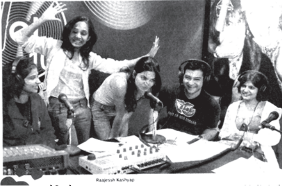
रेडियो गा गा

But what has made RJ-ing the coolest choice? Perhaps, it is the rising level of awareness among youngsters, who want something more and extraordinary when it comes to career. No run of the mill stuff for them because they are willing to risk and experiment. As actress Preity Zinta, who was an RJ in