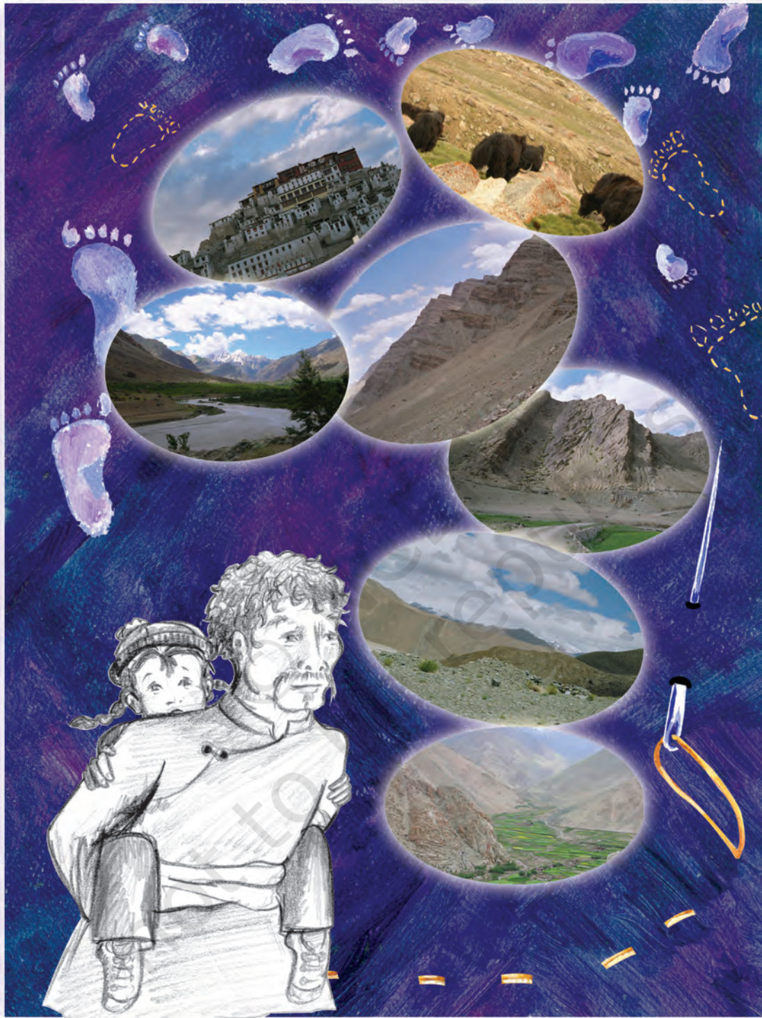
चुसकित और लद्दाख के कुछ चित्र