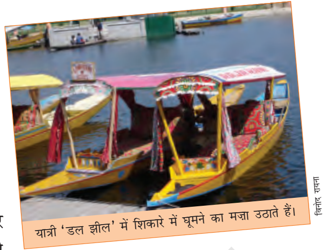
यात्री 'डल झील' में शिकारे में घूमने का मजा उठाते हैं।

अपने सफ़र की शुरुआत पर निकलने से पहले मैंने कभी सोचा भी न था कि एक ही राज्य में मुझे इतनी तरह के घर और लोगों के रहन-सहन के तरीके देखने को मिलेंगे। लेह में एक अनुभव था दुनिया की चोटी पर रहने का और श्रीनगर में अनुभव था पानी पर रहने का। इन इलाकों में घर भी ऐसे खास थे जो वहाँ के मौसम के अनुकूल थे।