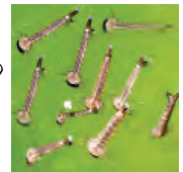
हैंड लेंस से देखने पर लारवे