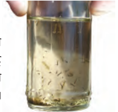
मच्छर के लारवे