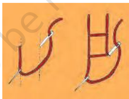
खुला हुआ ज़ंजीर टाँका