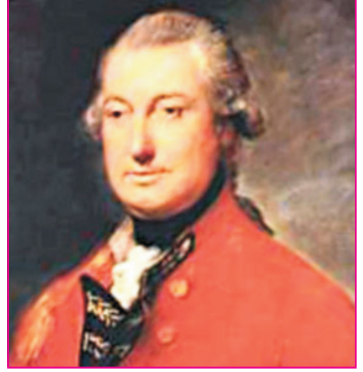
6.2 કોર્ન વોલિસ