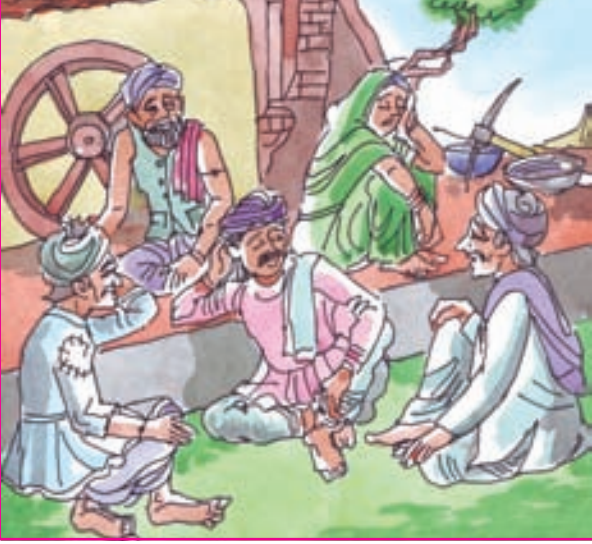
6.1 બરબાદ થયેલો ખેડૂતવર્ગ