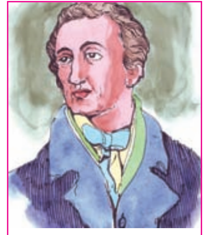
6.4 વિલિયમ બેન્ટિક

બેન્ટિકે કંપનીના વહીવટમાં ભારતીયોને સ્થાન આપ્યું. અદાલતમાં ન્યાય માગવા આવનારને માતૃભાષાનો ઉપયોગ કરવાની રજા આપવામાં આવી. રાજા રામમોહનરાય અને બીજા સુધારકો સતી થવાનો રાક્ષસી રિવાજ બંધ કરાવવા ઘણા વખતથી પ્રયાસ કરી રહ્યા હતા, બેન્ટિકે આ સુધારકોની વિનંતી