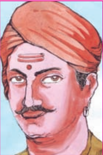
9.1 મંગલ પાંડે

એનફિલ રાઈફલમાં ગાય અને ડુક્કરની ચરબીવાળા કારતૂસ વાપરવાનો મંગલ પાંડેએ વિરોધ કર્યો. આ ઘટનાને લીધે 31મી મેએ નિશ્ચિત થયેલી સંગ્રામની શરૂઆત થોડા દિવસ વહેલી થઈ ગઈ. આયોજન ખોરવાયું પરિણામે વિપ્લવનું લક્ષ્ય પાર પાડી શકાયું નહિ.