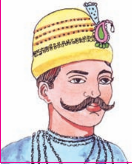
9.7 સેનાપતિ તાત્યા ટોપે