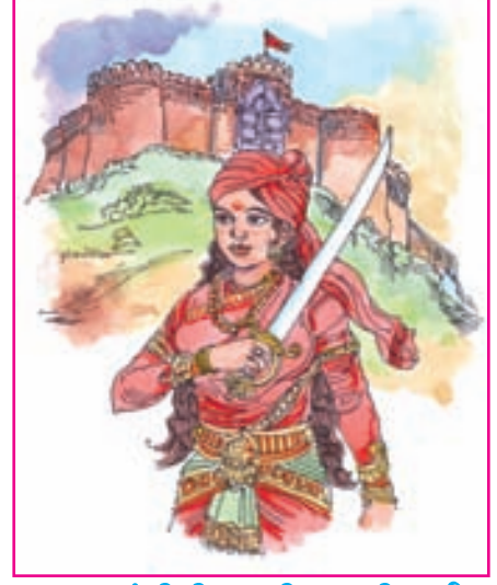
9.6 ઝાંસીની રાણી લક્ષ્મીબાઈ

ઝાંસીની મહારાણી લક્ષ્મીબાઈ એક વીરાંગના હતાં. તેમના દત્તક પુત્રનો ગાદી ઉપરનો હક અંગ્રેજોએ સ્વીકાર્યો ન હતો. આથી લક્ષ્મીબાઈ પણ સંગ્રામમાં જોડાયાં હતાં. તેઓ સંગ્રામમાં બાહોશ નેતાઓમાંના એક હતાં. તેમણે અંગ્રેજો સામે લડવા સ્ત્રીઓની એક સેના તૈયાર કરી હતી. તેઓ અંગ્રેજો સામે વીરતાપૂર્વક લડતા. અંગ્રેજ અધિકારીઓના મત મુજબ રાણી લક્ષ્મીબાઈ 1857ના સંગ્રામના આગેવાનોમાં શ્રેષ્ઠ સ્ત્રી-નેતા હતી.