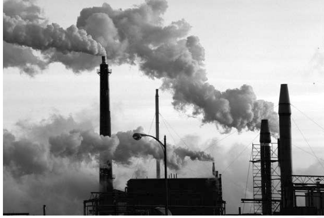
चित्र : फैक्ट्रियों से निकलते हुए धुएँ का दृश्य

Look at the picture given below and write the answers to the following questions :